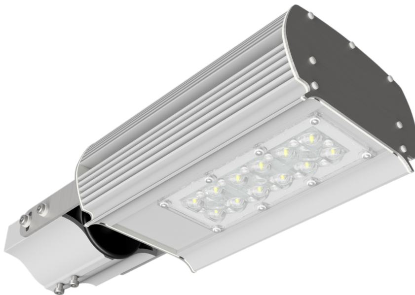
Vyžarovacia charakteristika M6.AA